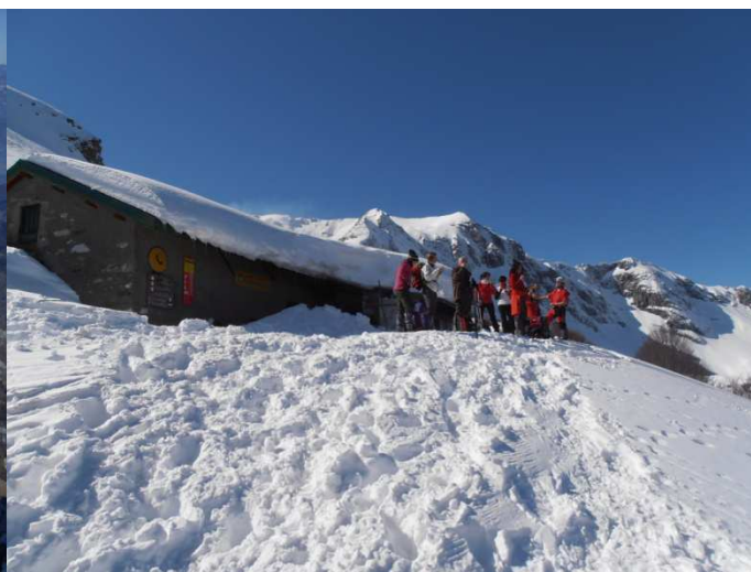
Il rifugio E.Rossi alla Pania