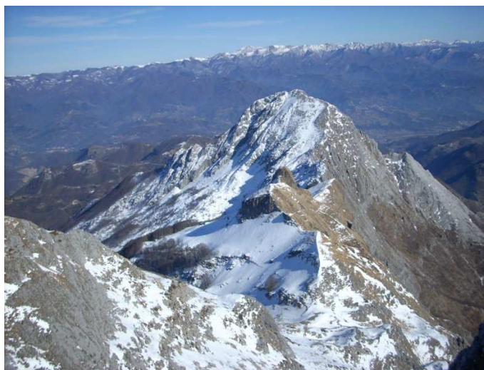
La Pania Secca vista dalla Pania della Croce

(classica invernale sulla Regina delle Apuane) (E.E. oppure E.E.A.)