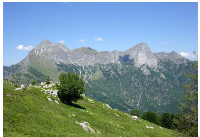
Panorama delle Panie dal monte Croce Fiore

Esso è diffuso in tutta Italia sopra i 600 metri ed è specie protetta.