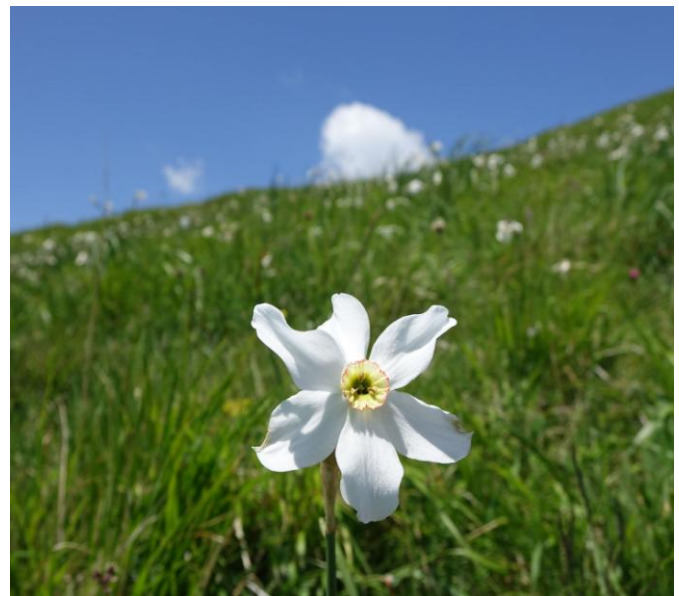
Giunchiglie o Narciso selvatico