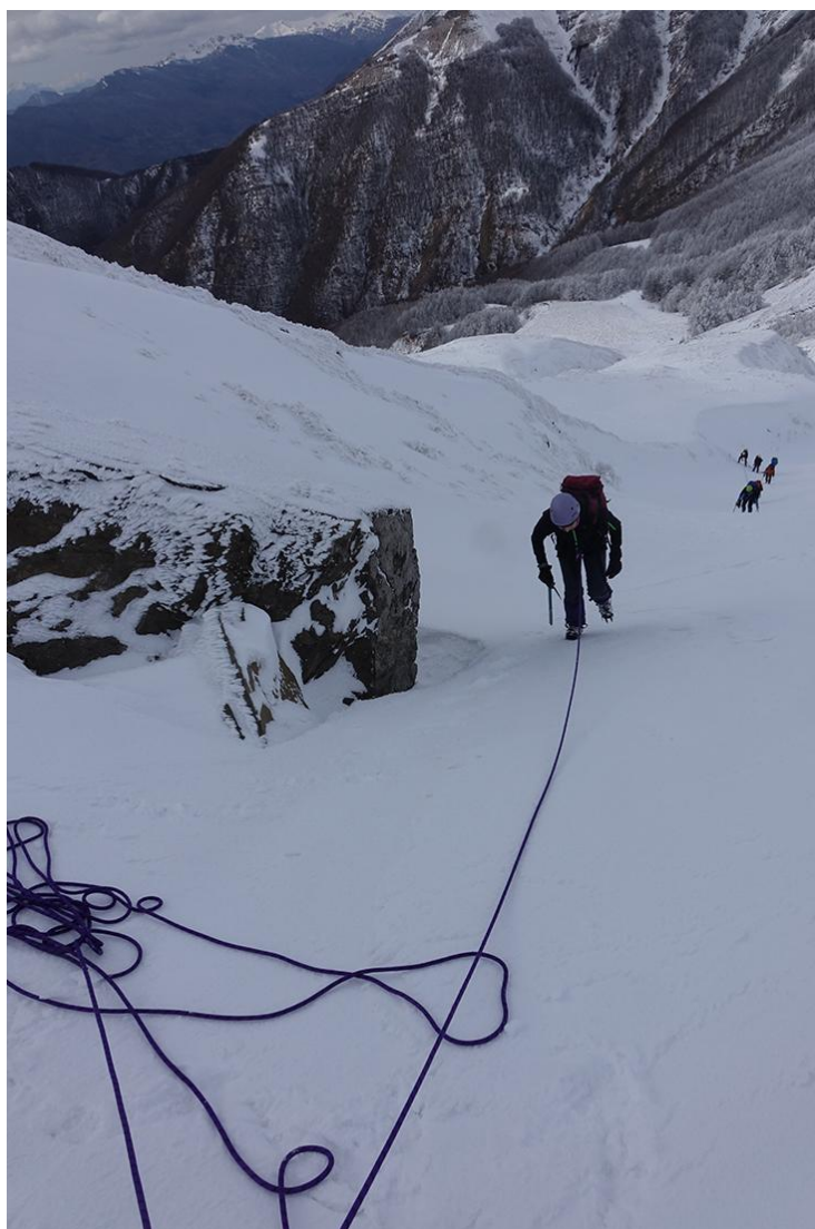
Salita al monte Gennaio per il Canalone Nord

Sezione Valdarno Inferiore "Giacomo Toni" Piazza Vittorio Veneto n. 4 -Fucecchio 50054 (FI) www.clubalpinoitaliano.it - info@clubalpinoitaliano.it